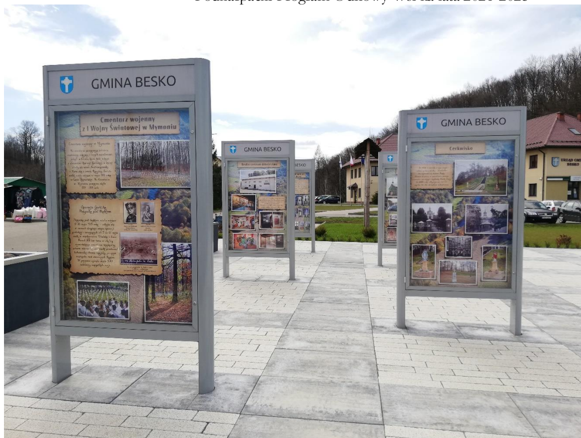
Skwer Pamięci – tablice informacyjne o historii gminy i jej atrakcyjnych miejscach.