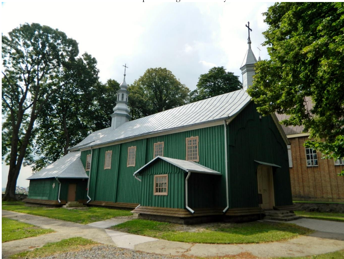
Zabytkowy kościół w Besku.