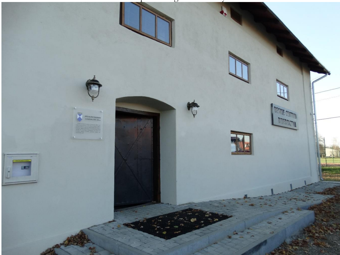
Beskie Centrum Dziedzictwa.