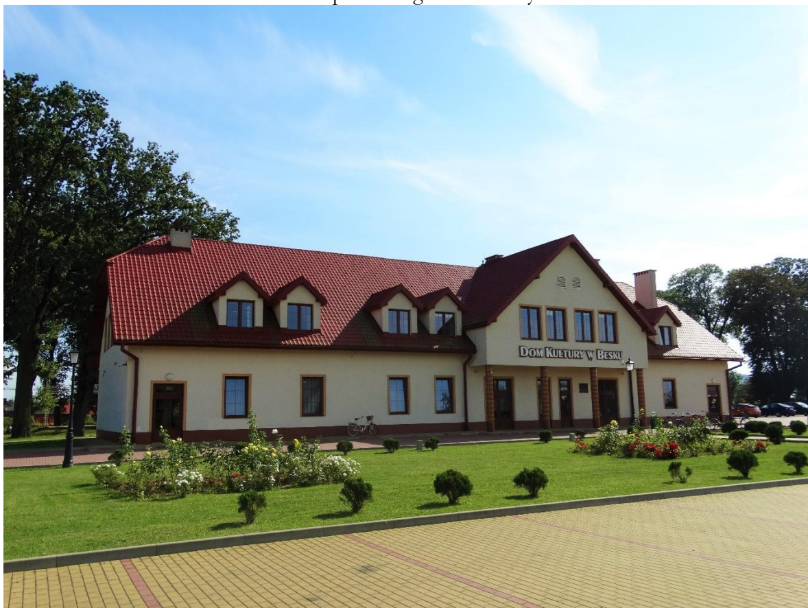
Dom Kultury w Besku.