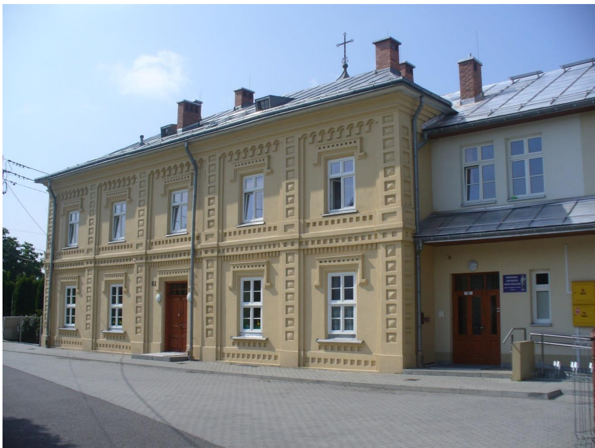
Przedszkole sióstr Felicjanek.