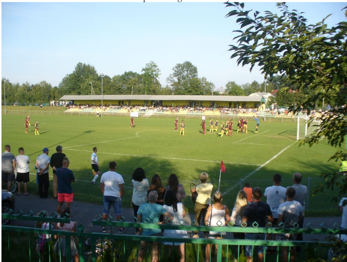
Stadion sportowy LKS Przełom Besko.