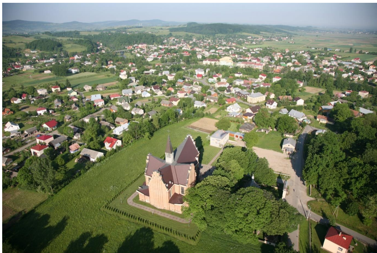
Kościół parafialny i Besko z lotu ptaka.