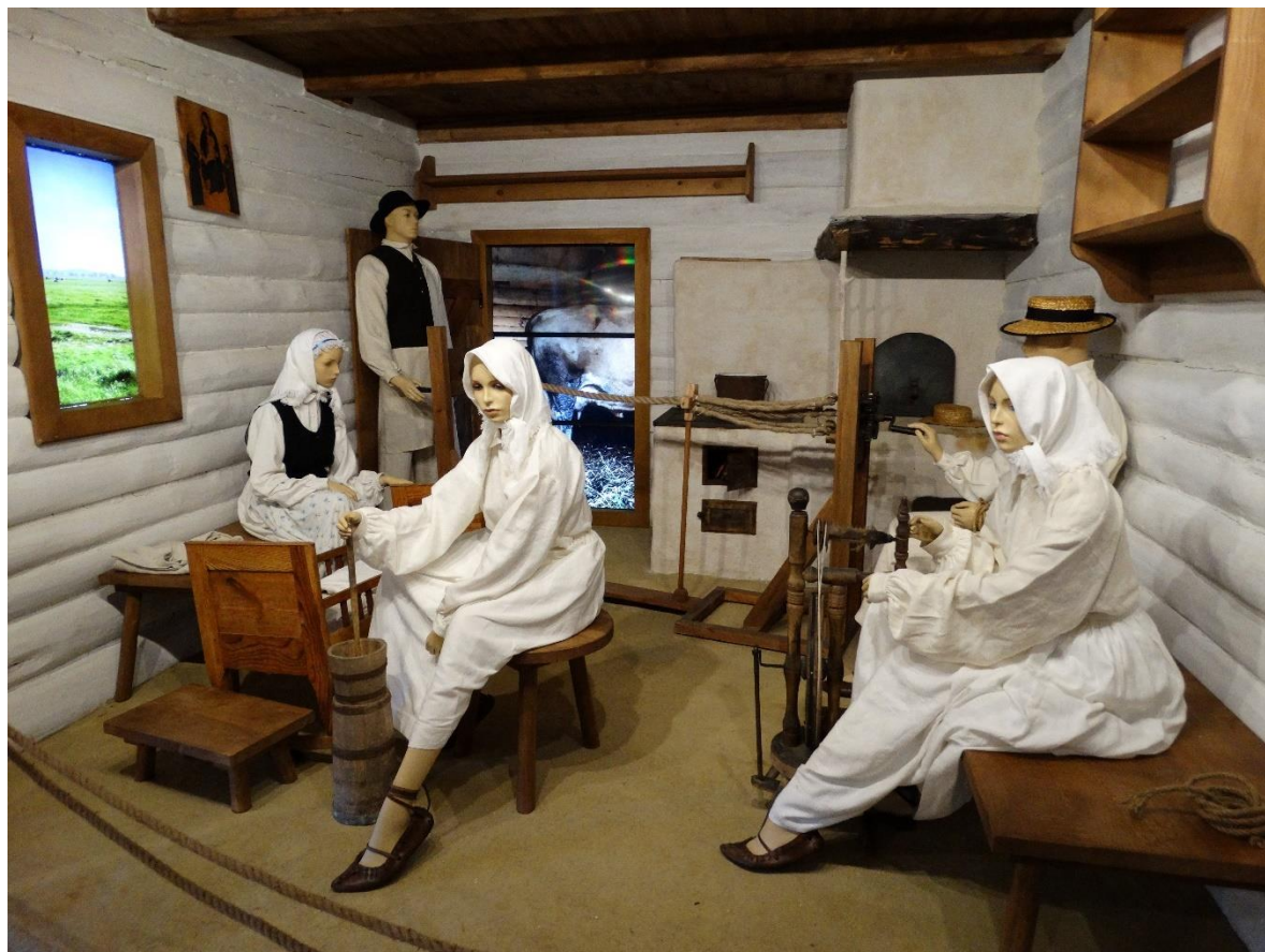
Ekspozycja w Beskim Centrum Dziedzictwa.