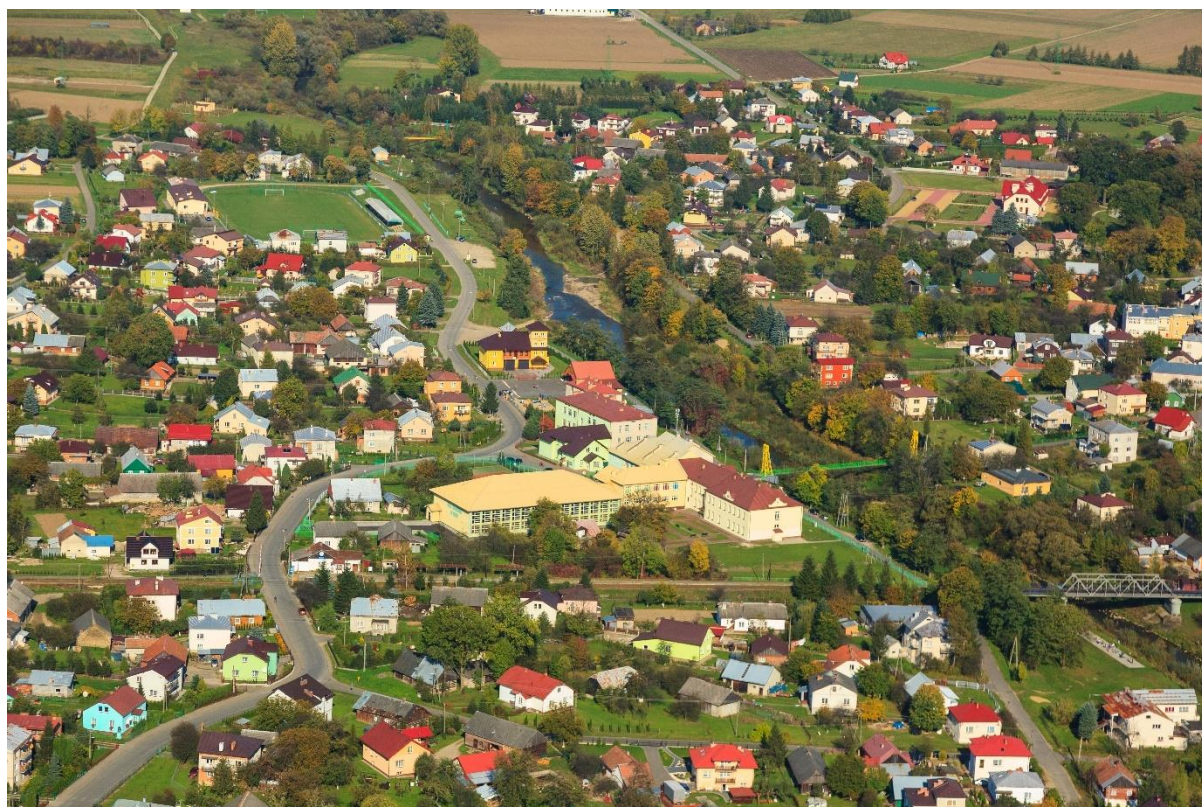
Besko z lotu ptaka. W oddali kompleks szkolny.