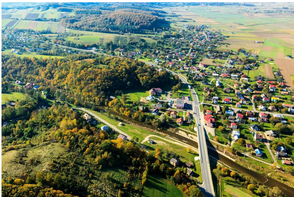
Besko z lotu ptaka.