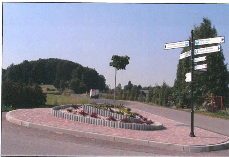
Skrzyżowanie ul. Olza i ul. Osiedłowa ze znakiem wskazującym najciekawsze miejsca w Mymoniu