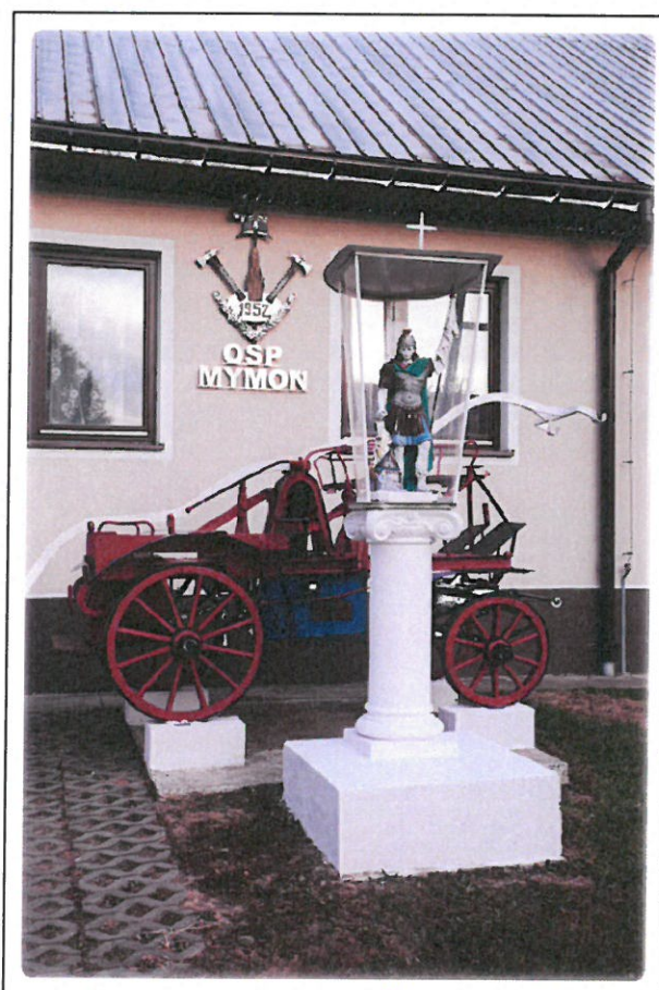
Dom Strażaka w Mymoni