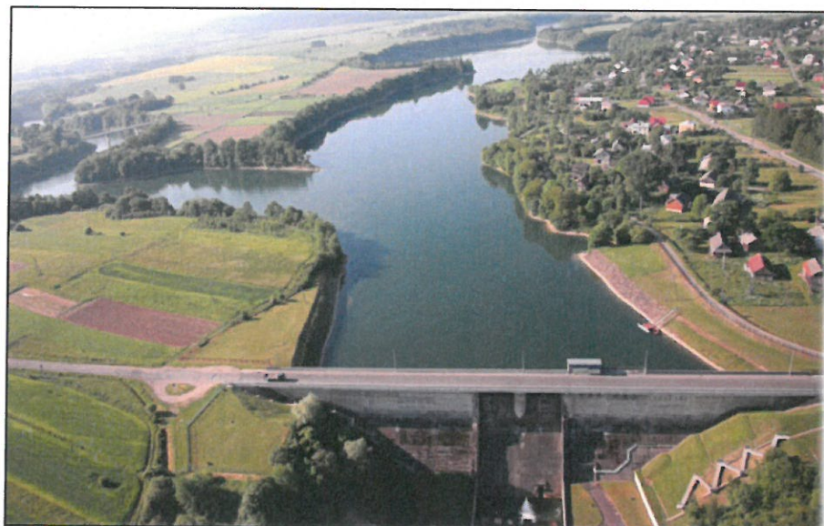
Zapora Besko na rzece Wisłok