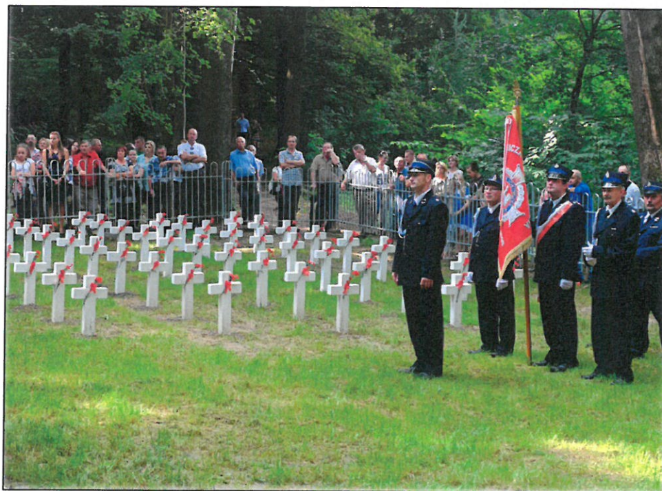
Uroczystości na cmentarzu z okresu I wojny światowej