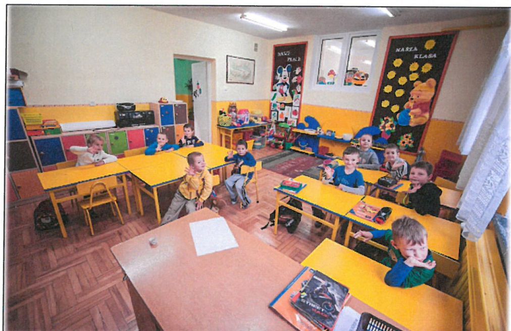
Szkoła Podstawowa w Besku Filia w Mymoniu