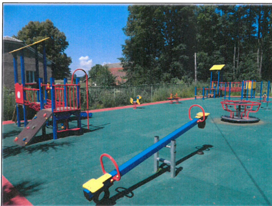
Plac zabaw przy Szkole w Mymoniu