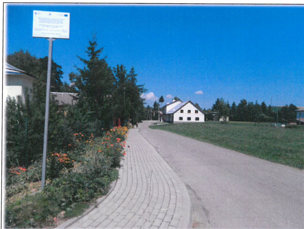
Mymoń ul. Olza