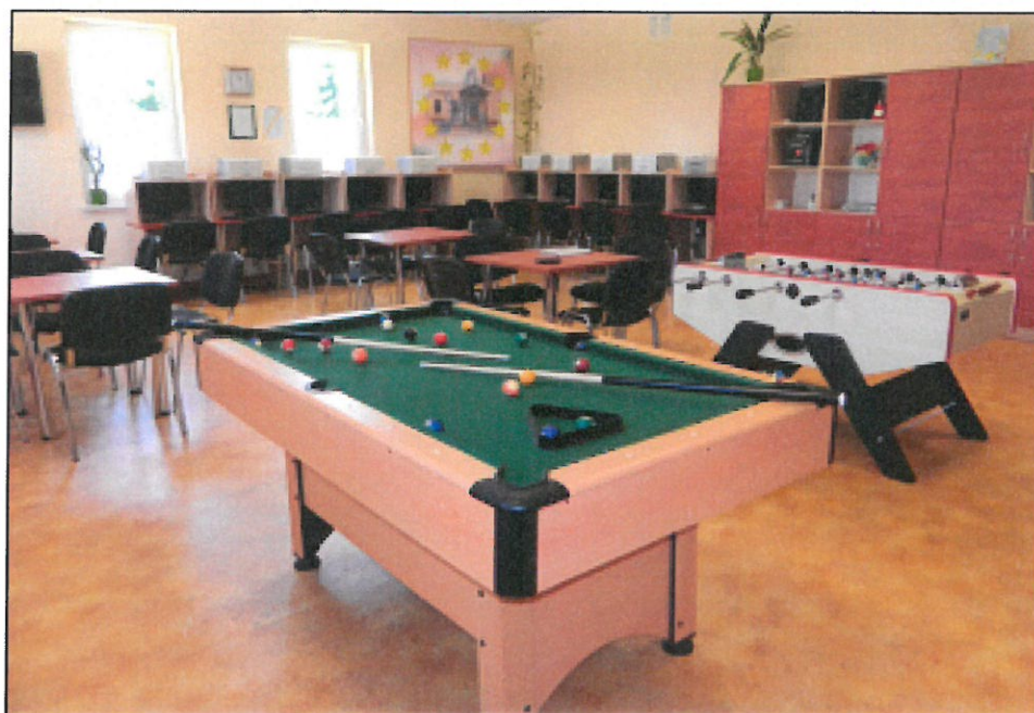
Świetlica młodzieżowa w Mymoniu